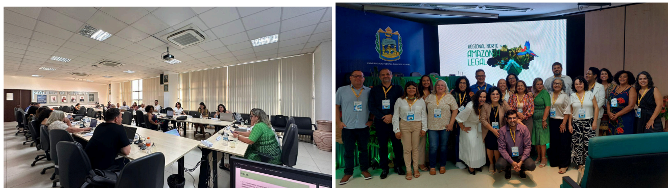
Figura 4 - Fórum de Pró-reitores e pró-reitoras da Região Norte/Amazônia Legal - FOPROP NORTE .