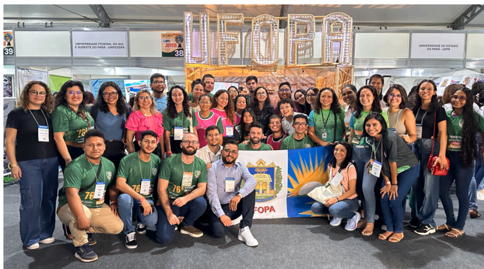
Figura 3 - Caravana da comunidade acadêmica da Ufopa na 76º SBPC.