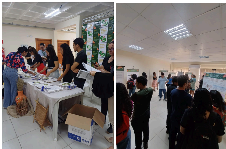
Figura 6 - Simpósio Acadêmico 2024.